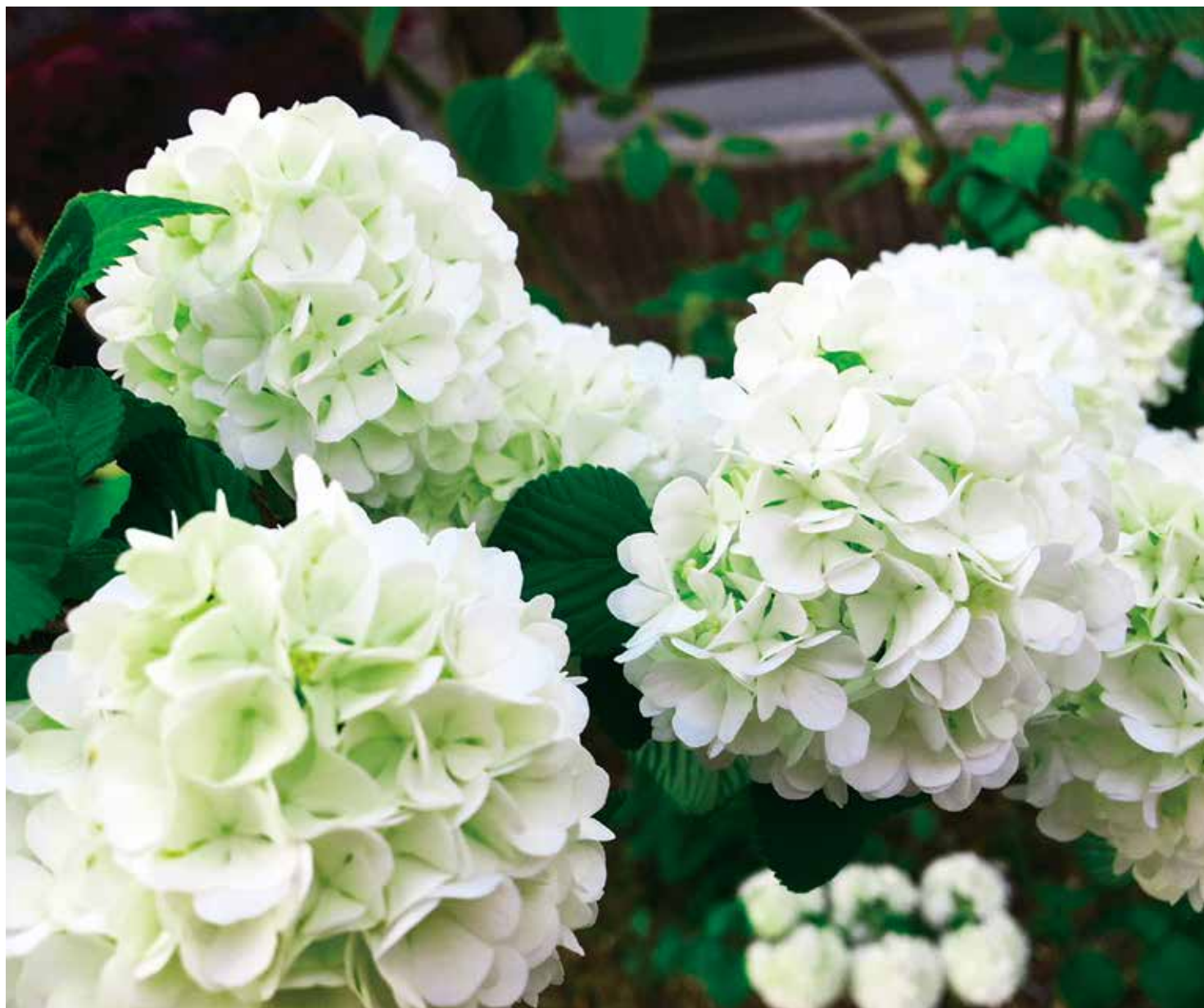
シリーズ土佐の感動風景 「おおでまり」

高さが2～3mになる低木で、5～6月に球状に密集した花を咲かせます。咲き始めが黄緑色で、開くと白色になります。花のかたまりは直径10cmを超し、まさしくオオデマリ(大手鞠)の名がぴったりです。英名のスノーボールもこの花姿から来ています。 (参考/ヤサシイエンゲイ)