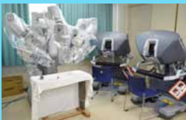
手術支援ロボット da Vinci Si™

PSAが低い・組織にて悪性度の低いなどの低リスクのがんでは、PSA検査や組織検査の繰り返しで経過をみるPSA監視療法などもあり、がんの状態、年齢、既往疾患などに基づき、患者さんやご家族の方と相談して決定します。当院では、放射線療法である小線源治療以外は対応が可能です。