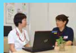
がん相談支援センター

当院には、がん相談支援センターもありますので、 お気軽にご相談においでください。