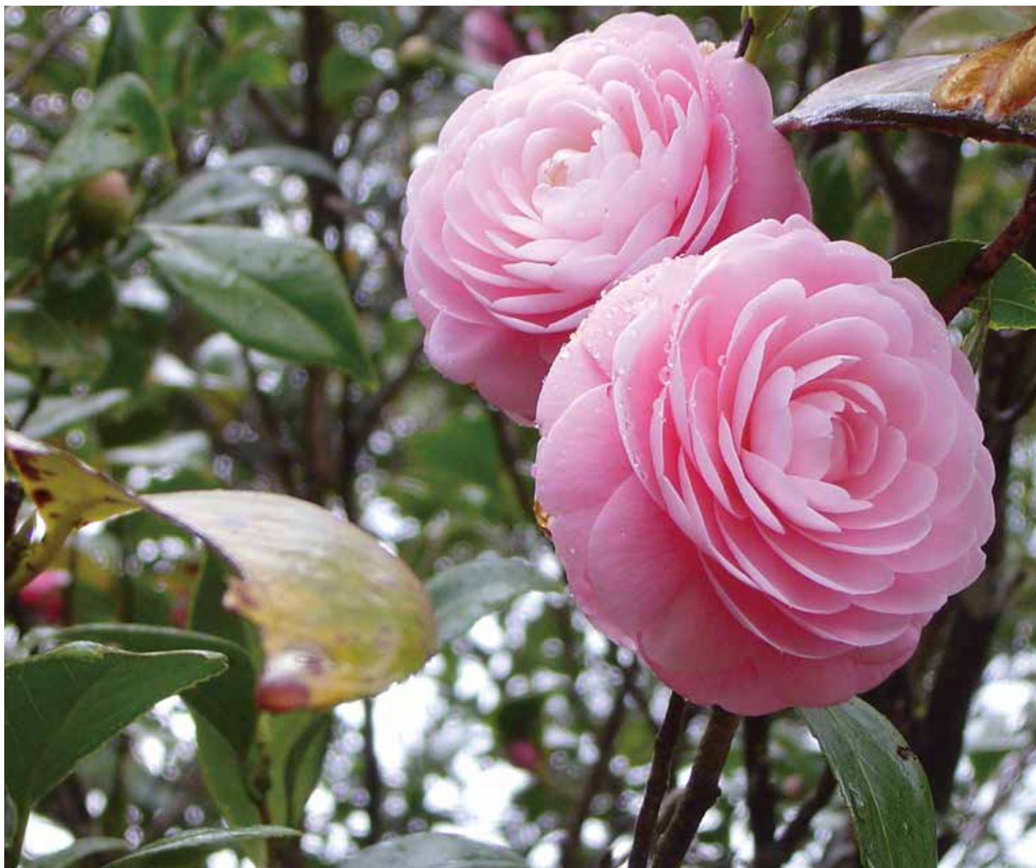
シリーズ土佐の感動風景 「乙女椿」