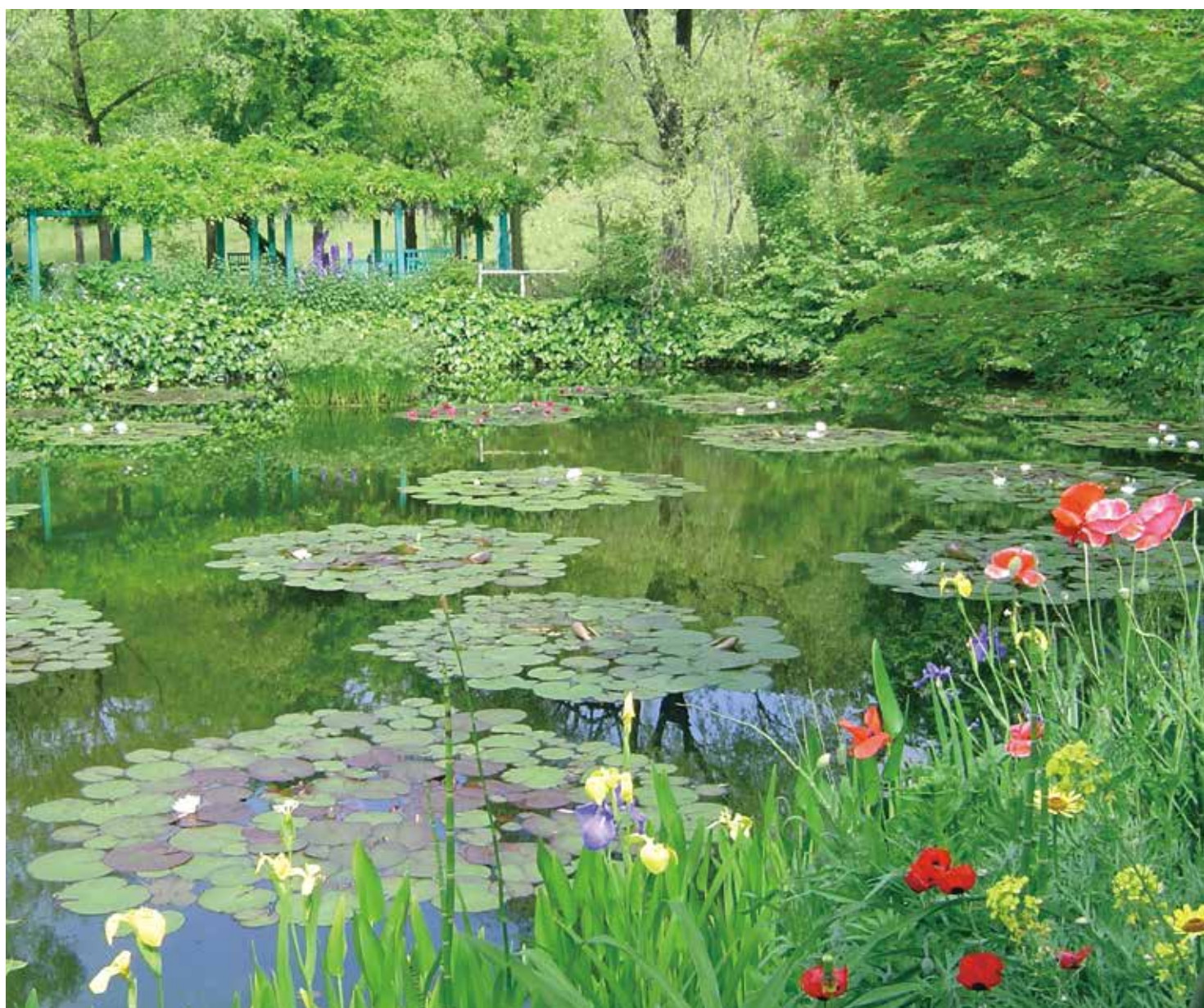
シリーズ土佐の感動風景 「モネの庭」

モネの愛した庭として有名なフランス、ジヴェルニーにある「モネの庭」を再現した北川村の「モネの庭」マルモッタン。これから、バラのアーチ、蓮の花も次々と咲き誇ります。