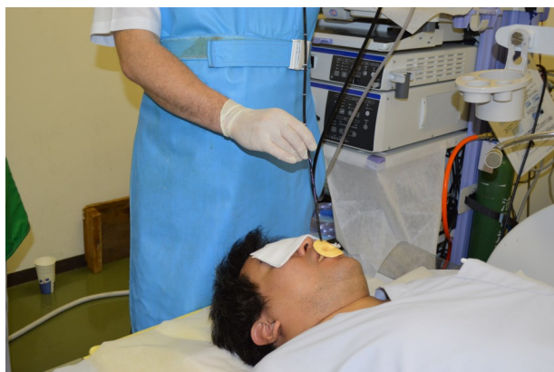
検査風景です。検査時間は約15分。