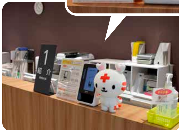
2階 総合受付①番 紹介窓口