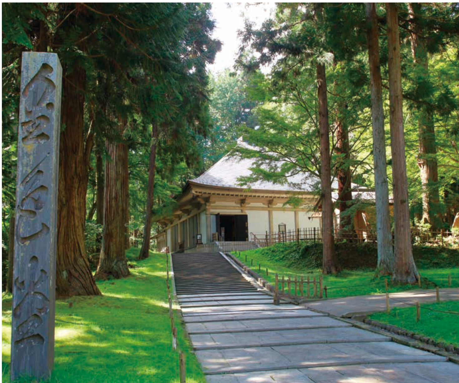
日本の風景 「中尊寺金色堂」

平安時代末期、奥州藤原氏が栄えた時代の寺院や遺跡群が多く残り、そのうち5件が「平泉—仏国土(浄土)を表す建築・庭園及び考古学的遺跡群—」の名で、2011年にユネスコの世界遺産リストに登録された。