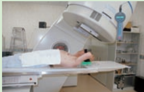
リニアックで治療中

に対して任意の角度から3次元的に照射を行うノンコプラナー法も行っています。また治療にあたっては、CTやMRIなど各種診断装置から得られた画像情報を統合し、綿密な治療計画をたてています。