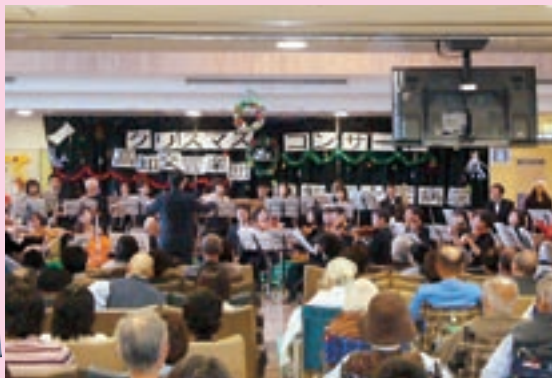
クリスマスならではの名曲が目の前で演奏され迫力満点！

、高知交響楽団によるクリスマスコンサートが、12月10日（日）、1階待合ホールで行われ、居合わせた入院患者の皆さまは美しい音色に聴き入っていました。