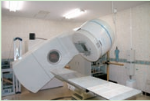
当院のリニアック

当院のリニアックは、近隣の医療機関と連携して放射線科専門医、放射線治療認定技師、看護師などの経験豊富なスタッフが年間120人以上の治療を行っています。放射線治療装置は、高エネルギーX線および5種類の電子線照射が可能な外部照射装置（リニアック）1台を設置しており、疾患に合わせて治療装置を選択しています。高エネルギーX線治療装置は多分割絞りを備えており、複雑な形状の照射野の作成が容易にできます。体の表面に近い病変に対してはその深さに応じて適切なエネルギーの電子線を選択して治療を行います。また複雑な照射を行う場合に必須である三次元治療計画が可能であるCTシミュレータを備えています。すべての治療は、CTシミュレータから治療計画装置、治療機器へオンラインでデータを転送し、コンピュータ制御で正確な放射線治療を行います。治療計画装置は、信頼性の高い線量分布計算を行うことができ、線量を病変部に高精度に集中させ、極力正常組織を避ける計画をたてることができます。頭頸部の放射線治療では眼球などの正常組織を避けるため、寝台を回転させて体軸